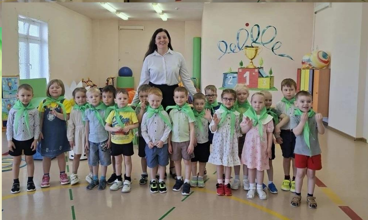
ПОСВЯЩЕНИЕ В ЭКОЛЮТА ВОСПИТАННИКОВ ГРУППЫ «ОГОНЕК»